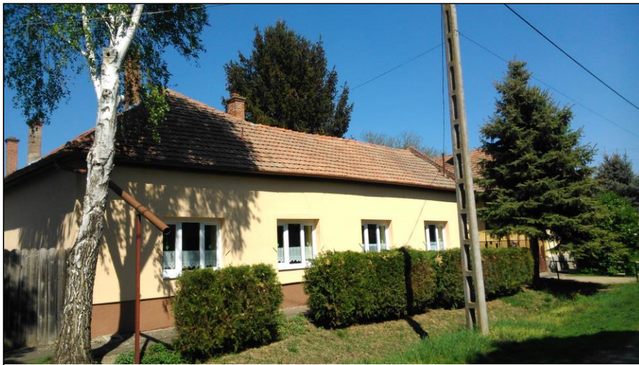
A Hunyadi János Katolikus Általános Iskola és Óvoda