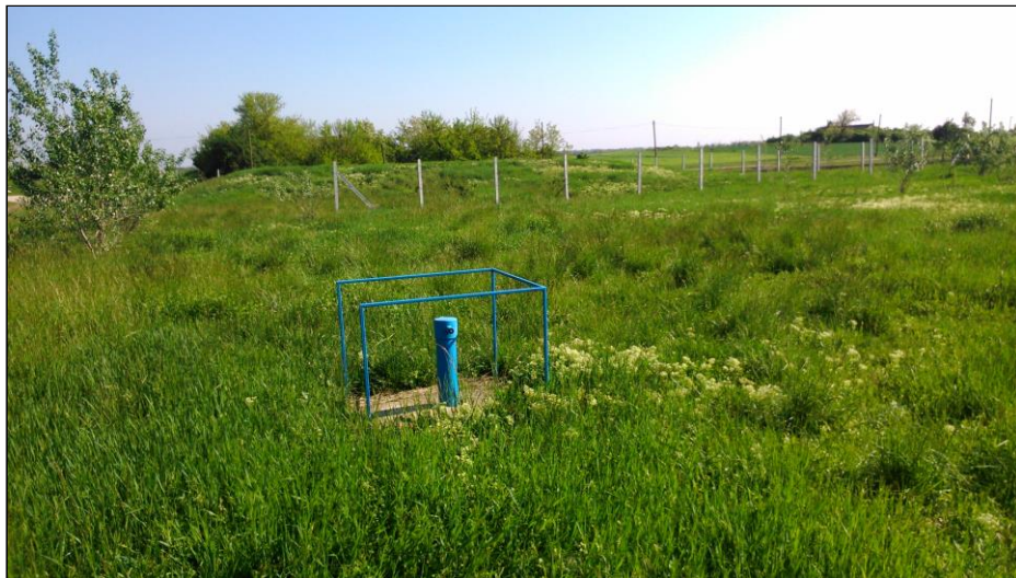
A talajvízfigyelő monitoring kút a telep D- i oldalán