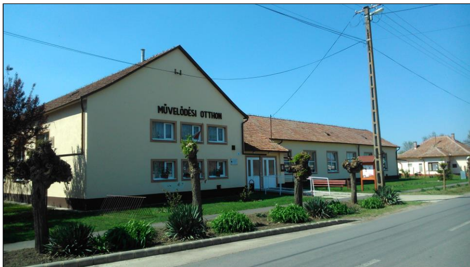
A Művelődési Ház