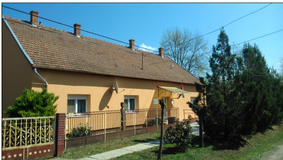
Az Idősek Klubja