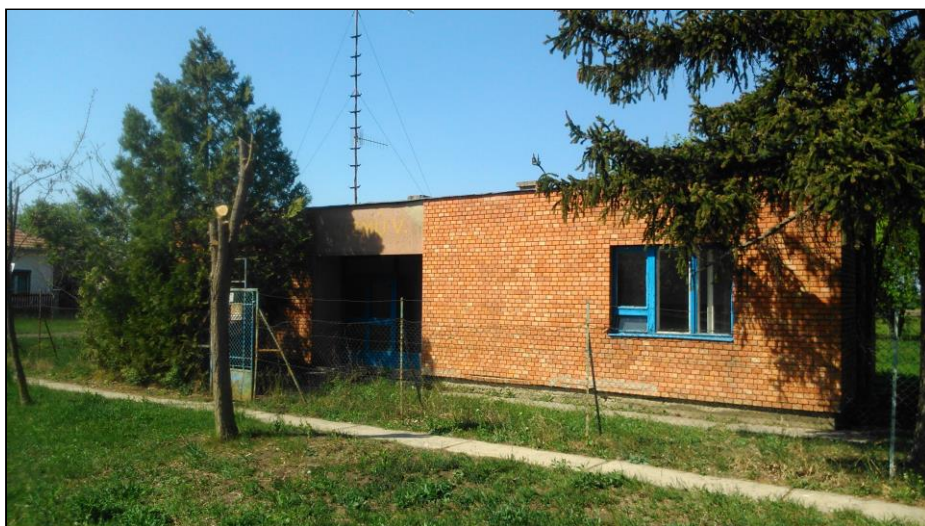
A régi VÍZMŰ telep