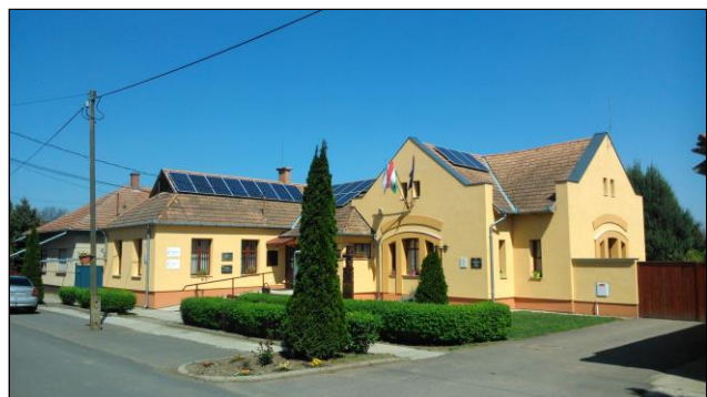
A Polgármesteri Hivatal