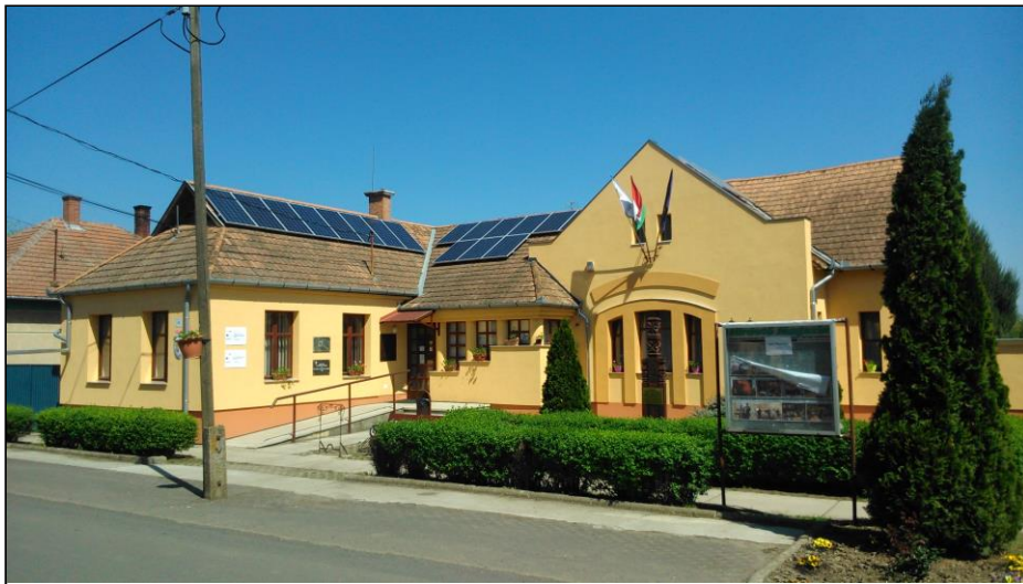
A Községháza épülete