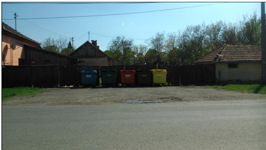
A szelektív gyűjtősziget a Petőfi út – Rákóczi út kereszteződésében