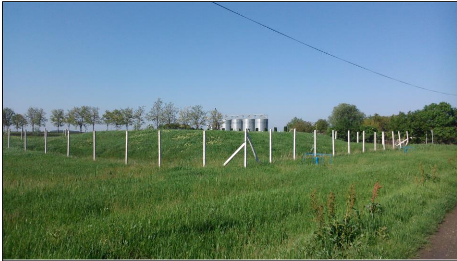
A rekultivált települési szilárdhulladék lerakó telep hrsz. 040/29 és 040/38