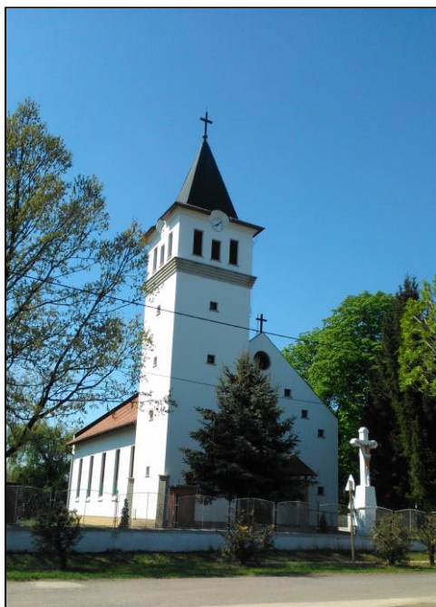
Az 1896- ban épült Római Katolikus templom