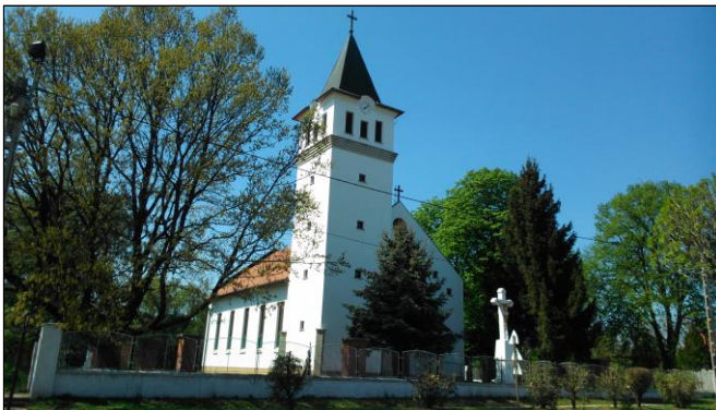
A Katolikus templom