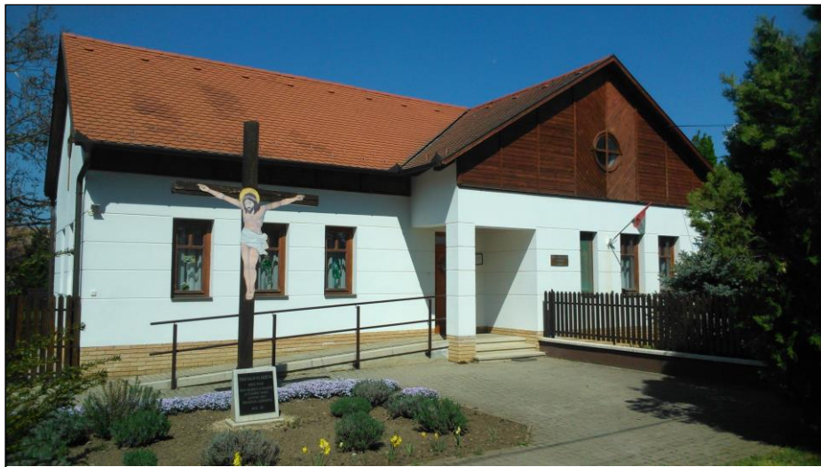
A Szent László király Plébánia épülete