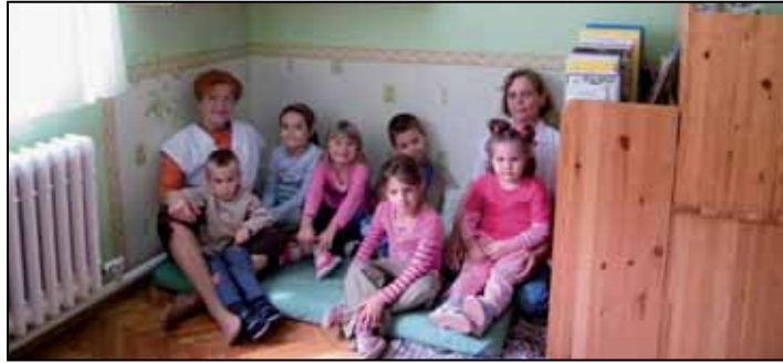
A gyerekek szép környezetbe kerültek

Szeptember elsejétől új helyen kezdődött meg a hunyai óvodások nevelése. A gyermekek kis létszámára való tekintettel, önkormányzati segítséggel, az iskola épületében alakítottak ki óvodai csoportszobát egy tanteremből. A felújítást természetesen az ÁNTSZ előírásait figyelembe véve végezték. Az új helyen lényegesen komfortosabb lett a gyermekek ellátása a korábbiánál. Az óvo- és a dajka néninek köszönhetően ízléses és hangulatos terem várja a kicsiket, akik kez-