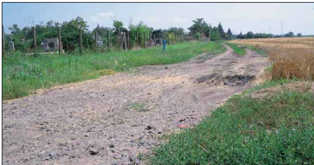
Az Ady Endre utcára is nagyon ráfér már a felújítás

Döntés született arról is, hogy az önkormányzat a 2011-es nap-