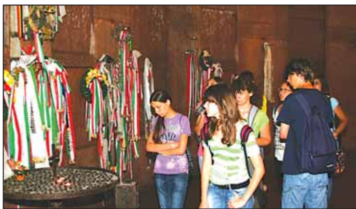
Mindszenty József hercegprímás sírjánál